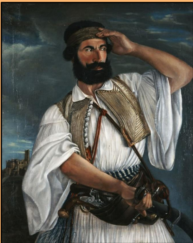
Εικόνα 4: Ο καπετάν Γκούρας, μετά το 1843. Λάδι σε μουσαμά, 98 x 80 εκ. Εθνική Πινακοθήκη, Συλλογή Ιδρύματος Ε. Κουτλίδη

Αφού μαζεύτηκαν εκεί, ύστερα από πρόσκληση του Ανδρούτσου, και άλλοι καπεταναίοι, ο Οδυσσέας Ανδρούτσος αμέσως συγκάλεσε πολεμικό συμβούλιο στο Χάνι της Γραβιάς, με τη συμμετοχή των οπλαρχηγών Δυοβουνιώτη και Πανουργιά. Εκεί τους πρότεινε να κλειστούν στο Χάνι να δώσουν τη μάχη, ώστε μη μπορώντας να υποχωρήσουν, να αναγκαστούν να πολεμήσουν πάση θυσία για να ανακόψουν την πορεία του Ομέρ Βρυώνη. Όμως ούτε ο Πανουργιάς, ούτε ο Γιάννης Δυοβουνιώτης δέχτηκαν διότι το έκριναν ακατάλληλο, επειδή ήταν πλινθόκτιστο και βρισκόταν σε ανοικτό πεδίο. Εν τω μεταξύ, ο Ομέρ Βρυώνης με 9.000 άνδρες πλησίαζε στη Γραβιά και είχε πληροφορηθεί την παρουσία του Ανδρούτσου στο χάνι με μικρή δύναμη. Δεν ανησύχησε, όμως, πιστεύοντας ότι ο Ανδρούτσος θα έκανε αποδεκτή την πρότασή του.