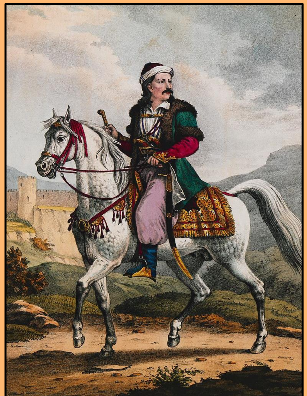
Εικόνα 3: Ο Οδυσσέας Ανδρούτσος ιππεύων, σχέδιο του Άνταμ Φρίντελ του 1830 περίπου.

Ο Ομέρ Βρυώνης λοιπόν, πριν ξεκινήσει από τα Τρίκαλα για την εκστρατεία του κατά των εξεγερμένων Ελλήνων της Πελοποννήσου, διέταξε τους καπεταναίους της Δυτικής Ελλάδας που του ήταν πιστοί, να μαζευτούν στη Γραβιά Φωκίδας. Σκοπό είχε, περνώντας από εκεί να τους έπαιρνε