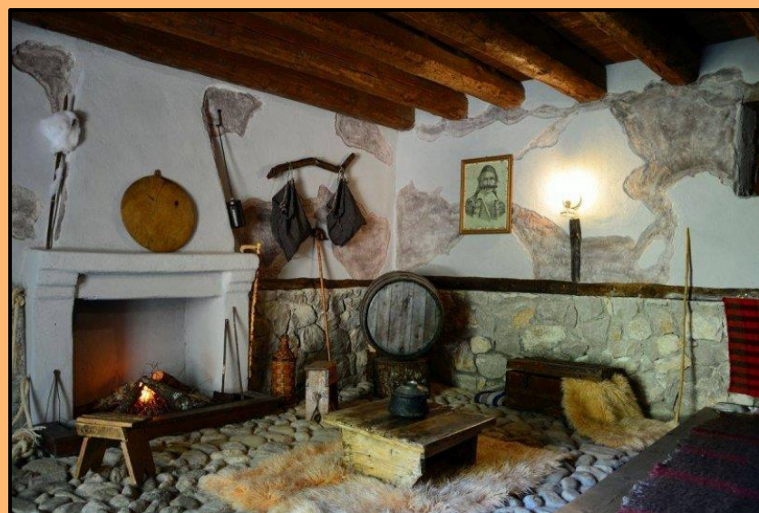
Εικόνες 8, 9, 10: Φωτογραφίες από το ανακατασκευασμένο Χάνι της Γραβιάς.