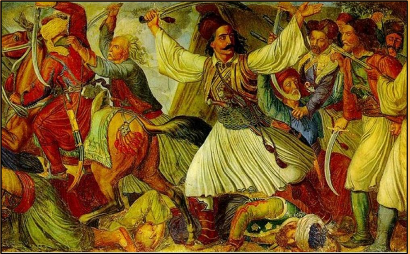
Εικόνα 6: Πίνακας εμπνευσμένος από μάχη.

γνώριζε ότι ο Ανδρούτσος ήταν Μουσουλμάνος Μπεκταξής. Ο δερβίσης προχώρησε έφιππος προς το Χάνι, αλλά ξαφνικά δέχθηκε μια σφαίρα στο μέτωπο κι έπεσε άπνους. Οι Οθωμανοί επιτέθηκαν κατά κύματα στο Χάνι. Οι Έλληνες πολεμιστές συνέχισαν να αποκρούουν τις τουρκικές επιθέσεις. Ο Ανδρούτσος και οι άνδρες του κρατούσαν γερά. Ο Ομέρ Βρυώνης εξοργίστηκε με την ανικανότητα των αξιωματικών του και διέταξε και νέα επίθεση κατά το μεσημέρι. Και αυτή απέτυχε.