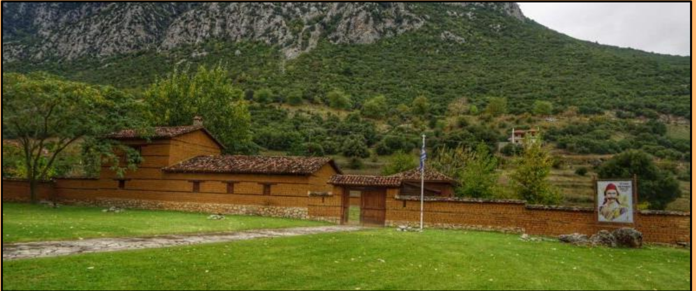
Εικόνα 1: Το ανακατασκευασμένο χάνι στη σημερινή Γραβιά.