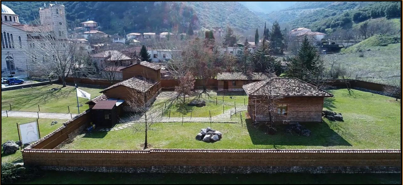
Εικόνα 7: Το Χάνι της Γραβιάς, άποψη από ψηλά.

Η Μάχη στο Χάνι της Γραβιάς στοίχισε στον Ομέρ Βρυώνη και επέφερε ισχυρό πλήγμα στις τουρκικές δυνάμεις. Τα θύματα των Τούρκων ήταν πολυάριθμα. Πάνω από 300 είχαν σκοτωθεί και 600 είχαν τραυματιστεί μέσα σε λίγες ώρες. Κυρίως, όμως, προκάλεσε κλονισμό στο ηθικό του στρατού του και τον δικό του δισταγμό για το αν έπρεπε να συνεχίσει την εκστρατεία του. Για λίγο καιρό, τουλάχιστον, ένας σοβαρός κίνδυνος για την Πελοπόννησο εξέλιπε. Η στρατηγική επιτυχία της μάχης αυτής ήταν μεγάλη και για τους επαναστατημένους Έλληνες, καθώς διευκόλυνε τη νίκη στο Βαλτέτσι, που εμπύχωσε τους Έλληνες και την επανάσταση. Ο Οδυσσέας Ανδρούτσος αναγνωρίστηκε απ' όλους ως αναμφισβήτητος ηγέτης της Ανατολικής Στερεάς.