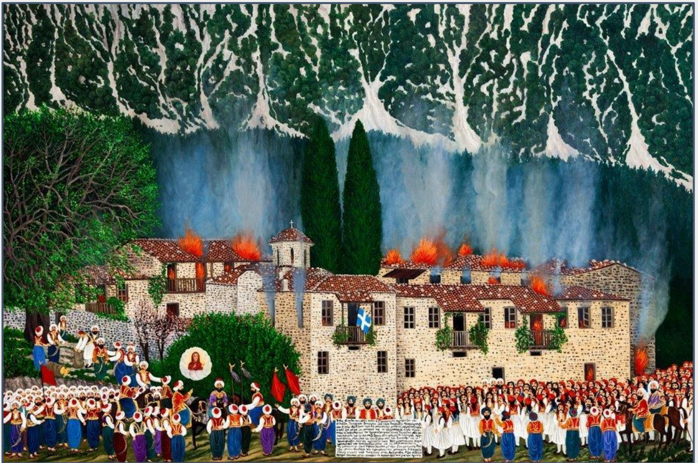
Εικόνα 9: Παναγία Ιερουσαλήμ Δαύλειας 1,20 X 0, 80, Ιωάννα Ξέρα.

Εξίσου σημαντική ήταν η Μονή Ιερουσαλήμ ή 'Γερσαλή' της Παναγίας στην Δαύλεια. Έγινε κέντρο ανεφοδιασμού των πρώτων επαναστατικών σωμάτων στην Ανατολική Ρούμελη δίνοντας όλα τα χρήματά της για τον Αγώνα και την επιβίωση υπόδουλων οικογενειών. Για το λόγο αυτό πολλές φορές πολιορκήθηκε, κατακτήθηκε και καταστράφηκε από τους Τούρκους.