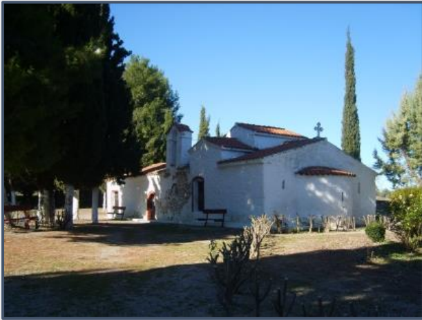
Εικόνα 11: Αγία Σωτήρα, Μαυρομάτι.