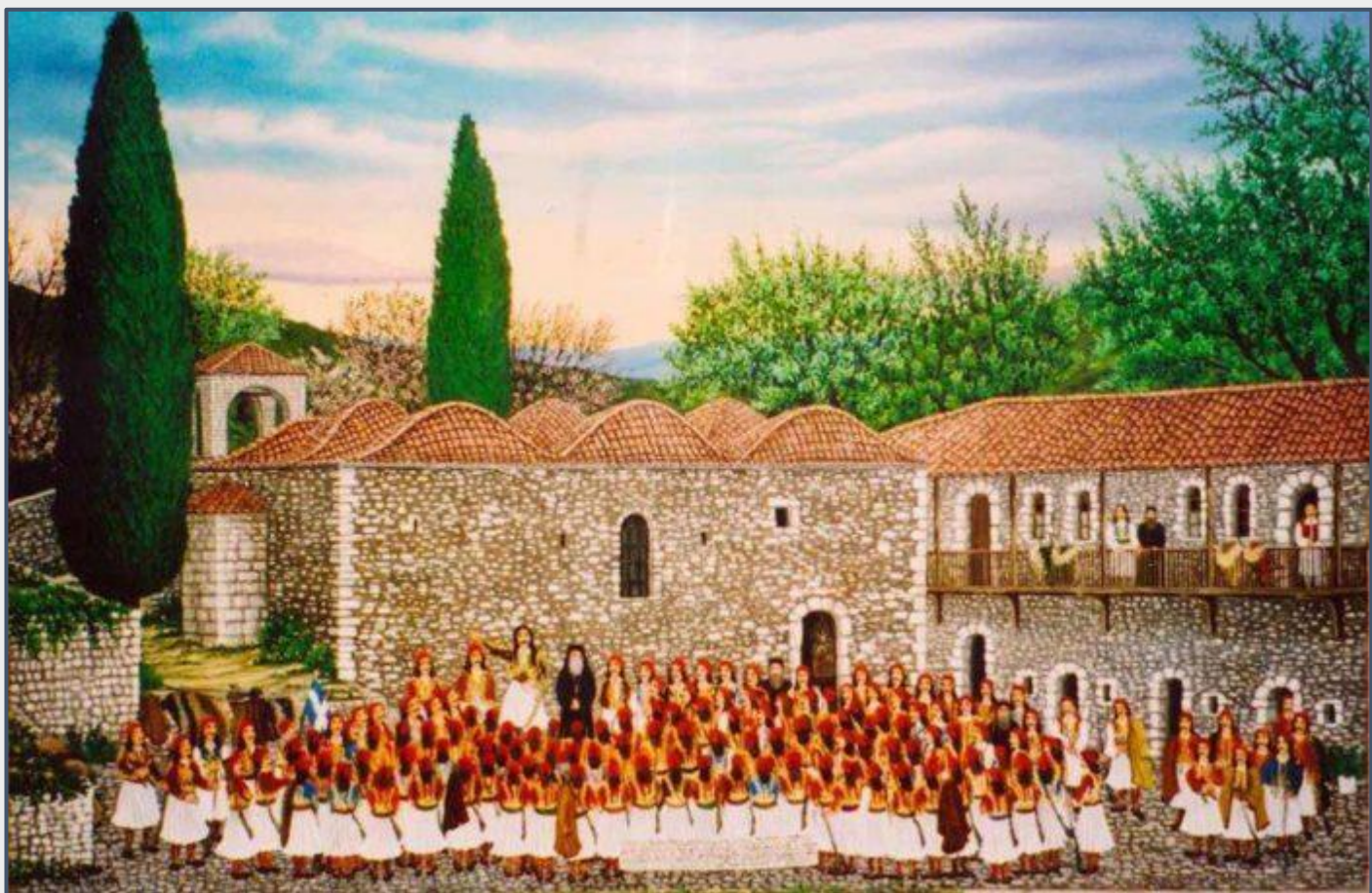
Εικόνα 4: Ιωάννα Ξέρα, Ιερά Μονή Λυκούρεση Βοιωτίας. Ελαιογραφία 1,20 X 0,80.

Στην Ιερά Μονή Λυκούρεση ή Παναγία του Μύρου της Χαιρώνειας, φιλοξενήθηκε ο Αθανάσιος Διάκος όταν περίμενε πολεμοφόδια και άντρες από την Αράχωβα για να πάει προς τη Λιβαδειά που την απελευθέρωσε την 31 η του Μάρτη. Ο Αθανάσιος Διάκος συγκέντρωσε στρατό από όλα τα γύρω χωριά και με όλα τα παλικάρια του ξεκίνησε απ' τη μονή Λυκούρεση την νύχτα 28 με 29 Μαρτίου 1821 για την απελευθέρωση της Λιβαδειάς.