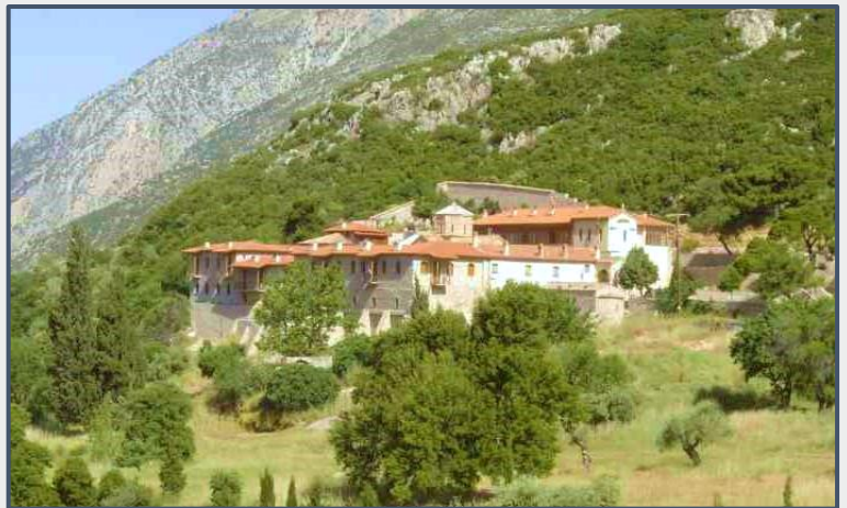
Εικόνα 12: Μονή Οσίου Σεραφείμ Δομβούς.