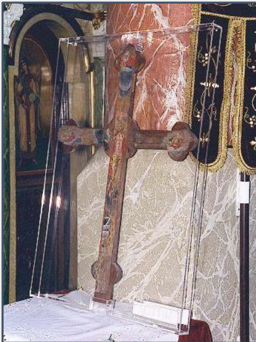
Εικόνα 7: Ο Σταυρός στον οποίο ο Διάκος όρκισε τους Αγωνιστές του.