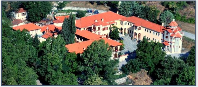
Εικόνα 13: Μονή Ευαγγελίστριας.

βρισκόταν η Αγία Τράπεζα μέσα στο ιερό του ναού. Η κρύπτη είναι αφιερωμένη στην Αγία Τριάδα και σε αυτήν έκρυβαν και τα ιερά κειμήλια της μονής που έπρεπε να προφυλαχθούν από τους αλλόθρησκους.