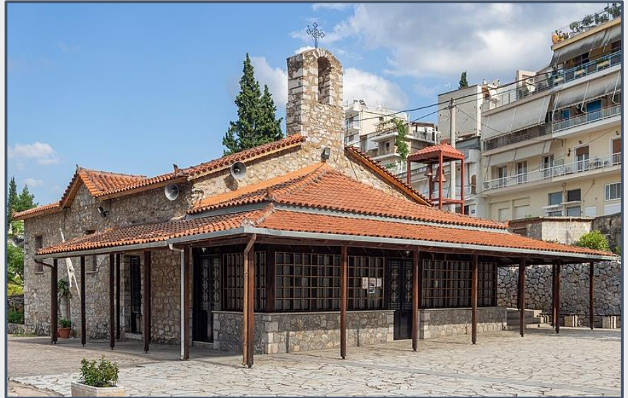
Εικόνα 6: Ι. Ν. Αγίας Παρασκευής Λιβαδειάς.

συγκινητικότατο λόγο τελειώνοντας με το "Καλύτερα μιας ώρας ελεύθερη ζωή παρά σαράντα χρόνια σκλαβιά και φυλακή". Έπειτα υψώθηκε από τον Διάκο η σημαία με τον Άγιο Γεώργιο και το σύνθημα ΕΛΕΥΘΕΡΙΑ Ή ΘΑΝΑΤΟΣ κεντημένο πάνω της. Οι δυο άνδρες λίγες μέρες αργότερα θα πέσουν ηρωικά μαχόμενοι για την ελευθερία της πατρίδας· 23 Απριλίου, ανήμερα του Αγίου Γεωργίου, ο Ησαΐας έπεσε μαχόμενος στη Χαλκωμάτα και ο Διάκος συλλήφθηκε στην Αλαμάννα.