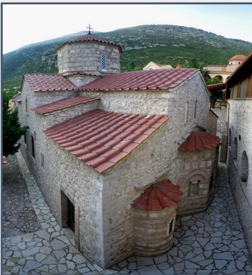
Εικόνα 13: Μονή Μακαριωτίσσης.

Στη Μονή Μακαριωτίσσης, στις πλαγιές του όρους Ελικώνας πάνω από το χωριό Δομβραίνα, έβρισκαν καταφύγιο κλέφτες κι αρματολοί που δρούσαν στην περιοχή κατά τη διάρκεια της τουρκοκρατίας. Λόγω της θέσης της υπήρξε πέρασμα μεταφοράς πολεμοφοδίων και στρατού μεταξύ Πελοποννήσου και Στερεάς. Το Νοέμβριο του 1826 Τουρκαλβανοί υπό τις διαταγές του Μουσταφάμπεη, κατέλαβαν τη μονή και πυρπόλησαν το ναό.