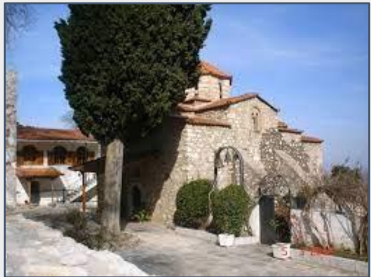
Εικόνα 14: Μονή Αγίου Νικολάου του νέου, Υψηλάντης Βοιωτίας