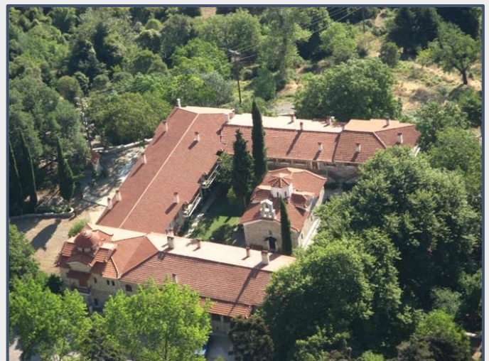
Εικόνα 10: Μονή Ιερουσαλήμ, Δαύλεια.

Η Παναγία παρουσιάζεται στον ύπνο του Σελίμ και τον διατάζει να το ξαναφτιάξει... Εκείνος πρόσταξε τους 200 χριστιανούς αιχμαλώτους που τον ακολουθούσαν να το επισκευάσουν.