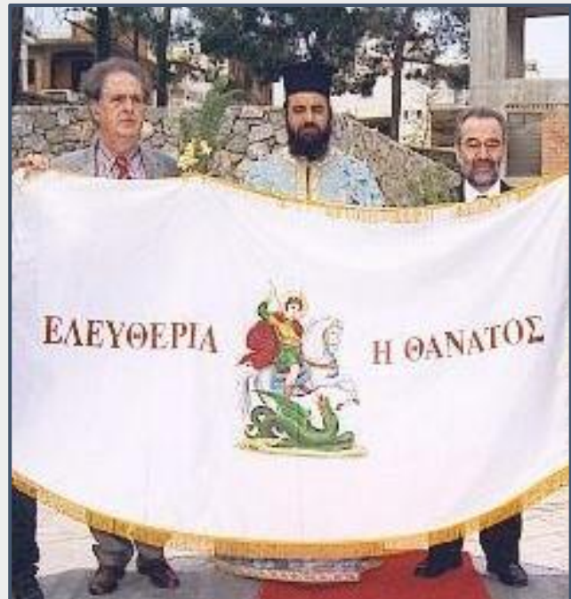
Εικόνα 8: Από εκδήλωση της ενορίας, την ημέρα της επετείου της κήρυξης της Επανάστασης.