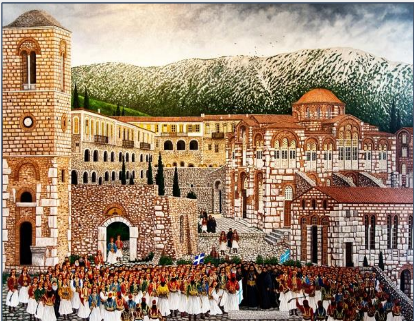
Εικόνα 1: Όσιος Λουκάς Βοιωτίας, έργο της ζωγράφου Ιωάννας Ξέρα.

Η Ιερή μονή του Οσίου Λουκά τον εν Στειρίω έγινε το ορμητήριο της Ρούμελης αφού πρώτα ο Ησαΐας Δεσπότης Σαλώνων με τον Αθανάσιο