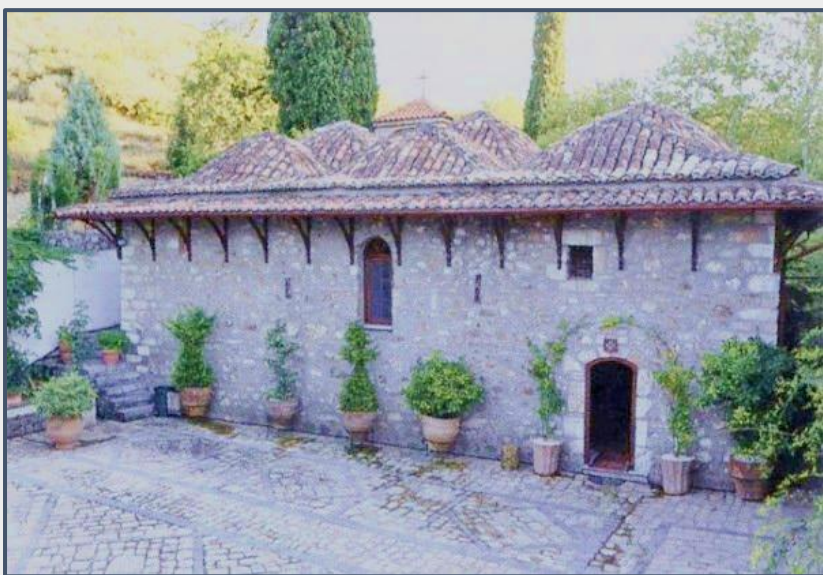
Εικόνα 5: Ιερά Μονή Λυκούρεση ή Παναγία του Μύρου, Χαιρώνεια.

Στην Ιερά Μονή Λυκούρεση ή Παναγία του Μύρου της Χαιρώνειας, φιλοξενήθηκε ο Αθανάσιος Διάκος όταν περίμενε πολεμοφόδια και άντρες από την Αράχωβα για να πάει προς τη Λιβαδειά που την απελευθέρωσε την 31 η του Μάρτη. Ο Αθανάσιος Διάκος συγκέντρωσε στρατό από όλα τα γύρω χωριά και με όλα τα παλικάρια του ξεκίνησε απ' τη μονή Λυκούρεση την νύχτα 28 με 29 Μαρτίου 1821 για την απελευθέρωση της Λιβαδειάς.