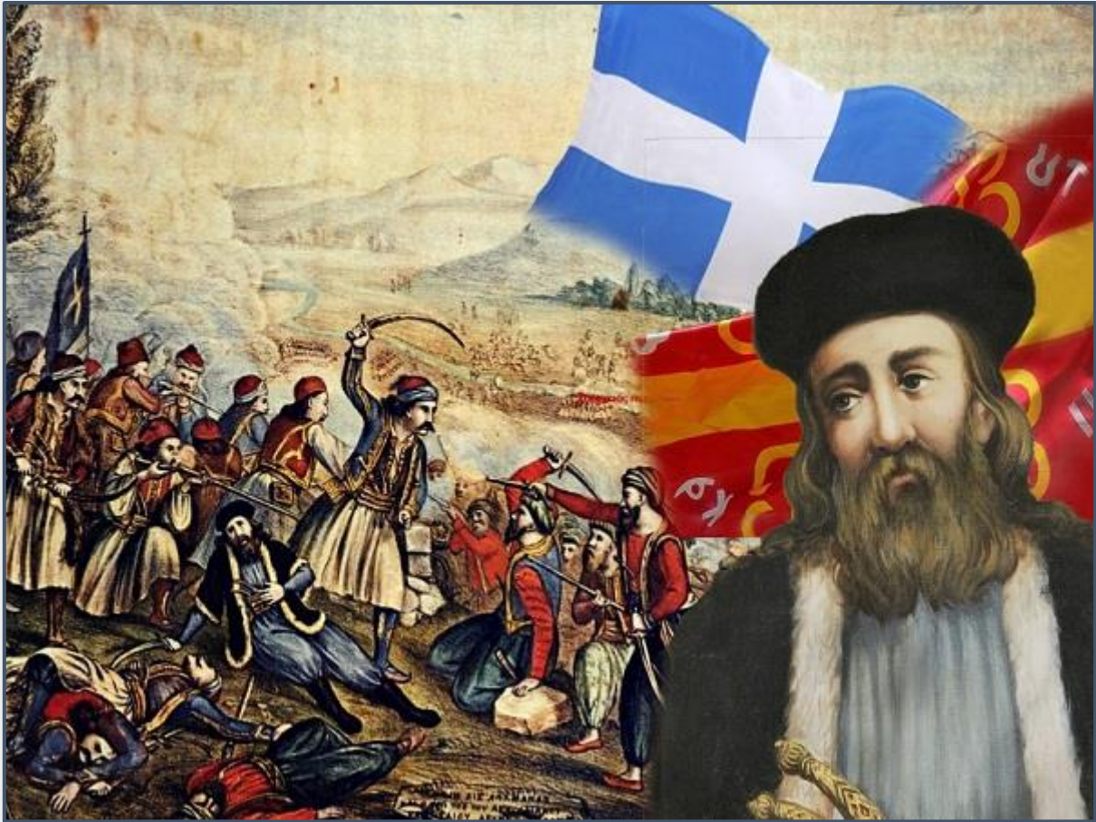
Εικόνα 2: Ο Ησαΐας Δεσπότης Σαλώνων.

Διάκο, ευλόγησαν στις 27 Μαρτίου 1821 τα ρουμελιώτικα όπλα και κήρυξαν επίσημα την Επανάσταση. Μετά την πυρπόληση της Λιβαδειάς τον Ιούνιο του 1821 από τον Ομέρ Βρυώνη, οι επαναστάτες συγκεντρώθηκαν στην μονή και άρχισαν να επιστρέφουν στο Μοριά.