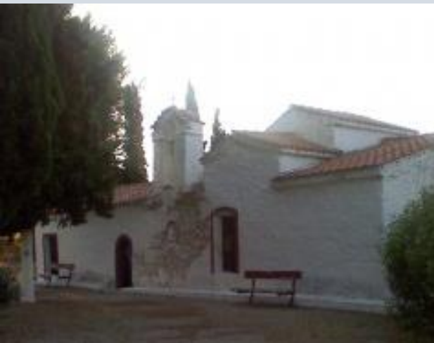
Εικόνες 2,3: Εκκλησία Αγίας Σωτήρας.

Ο Αθανάσιος Σκουρτανιώτης, μετά από μία λάθος κίνηση του Δρίτσουλα που θέλοντας να βοηθήσει πρόδωσε τη θέση του οπλαρχηγού, αφού όρμησε σε μία ομάδα Τούρκων σκοτώνοντας τους αλλά δίνοντας την ευκαιρία σε αυτούς που έζησαν να φέρουν ενισχύσεις, βρέθηκε σε πολύ δύσκολη θέση. Πρόλαβε να φτάσει και να οχυρωθεί με τον Δρίτσουλα στην Αγία Σωτήρα σε ένα εκκλησάκι στο χωριό Μαυρομάτι Βοιωτίας, αλλά η θέση του δεν ήταν ευνοϊκή και οι Τούρκοι βάζοντας πίσσα και θειάφι στη στέγη της μονής τους έκαψαν. Αυτός ο σημαντικότερος ήρωας ήταν ένας από τους πολλούς ανθρώπους της εποχής που θυσιάστηκαν με αυταπάρνηση για να ζούμε εμείς σήμερα ξέγνοιαστοι και να απολαμβάνουμε το πολυτιμότερο αγαθό, την ελευθερία.