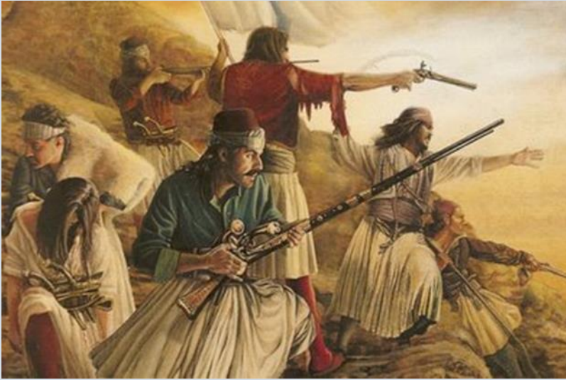
Εικόνα 6: Έλληνες αγωνιστές του 21, του Θάνου Βασιλικού.