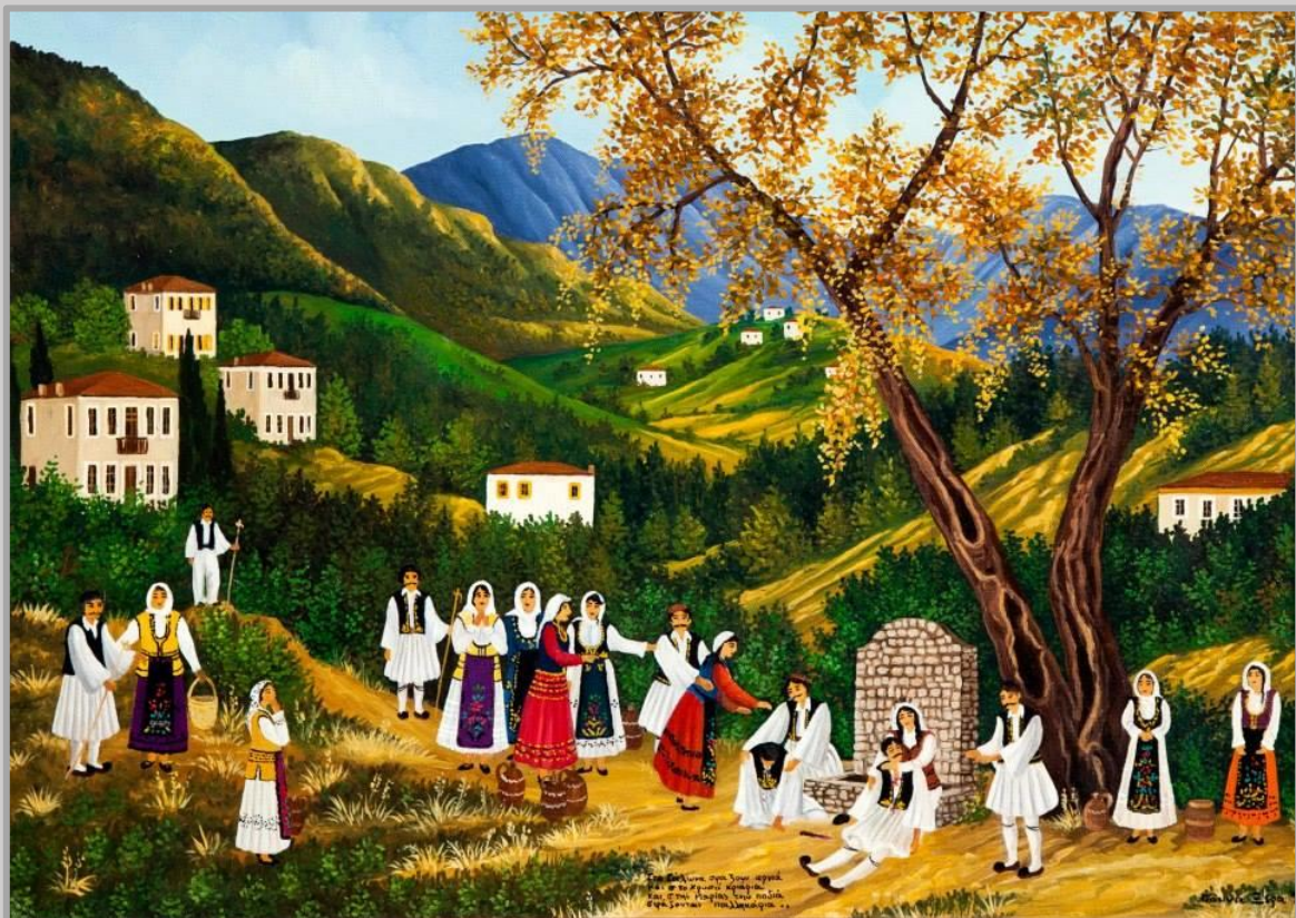
Εικόνα 8: Στα Σάλωνα σφάζουν αρνιά και στο Χρισσό κριάρια, και στις Μαρίας την ποδιά σφάζονται παλληκάρια. Πίνακας της Ιωάννας Ξέρα.