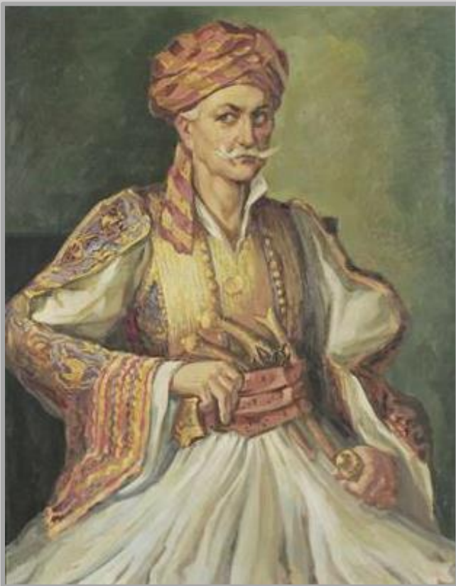
Εικόνα 2: Πορτρέτο του Πανουργιά (Δημήτριου Ξηρού), ελαιογραφία σε καμβά, Εθνικό Ιστορικό Μουσείο.

Ο Πανουργιάς έβαλε επί αποδείξει του, 14000 γρόσια με σκοπό να καλύψει τα έξοδα της στρατολόγησης μαχητών. Διέταξε το γαμπρό του και οπλαρχηγό Θανάση Μανίκα μαζί με τον Παπανδρέα από την Κουκουβίστα, να στρατολογήσουν στα βλαχοχώρια όλους όσους μπορούσαν να κρατήσουν όπλο. Έστειλε και τον ξάδερφό του Γιάννη Γκούρα στον Άγιο Γεώργιο να στρατολογήσει, και αυτός να συνεννοηθεί με τους κατοίκους του Γαλαξιδίου. Οι θαρραλέοι Γαλαξιδιώτες δέχτηκαν με ομόφωνο ενθουσιασμό το επαναστατικό κίνημα και ανακήρυξαν τον Γκούρα αρχηγό τους. Η συμμετοχή αυτή του Γαλαξιδίου είχε εξαιρετική σημασία.