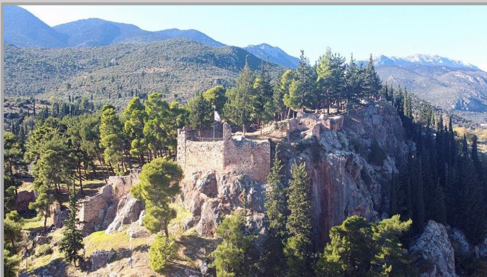
Εικόνα 7: Σύγχρονη άποψη του Κάστρου της Άμφισσας.

Σήμερα μπορείτε να το επισκεφθείτε με τα πόδια από την πόλη της Άμφισσας ή με το αυτοκίνητο ακολουθώντας τις πινακίδες από την ασφαλτο. Στο εσωτερικό του σώζονται ερείπια φραγκικής εκκλησίας, μικρής βυζαντινής και ρωμαϊκού τεμένους. Επίσης μπορείτε να δείτε δύο στρογγυλούς πύργους, ο καλύτερος από τους οποίους λέγεται «Πύργος της Βασιλίσσης».